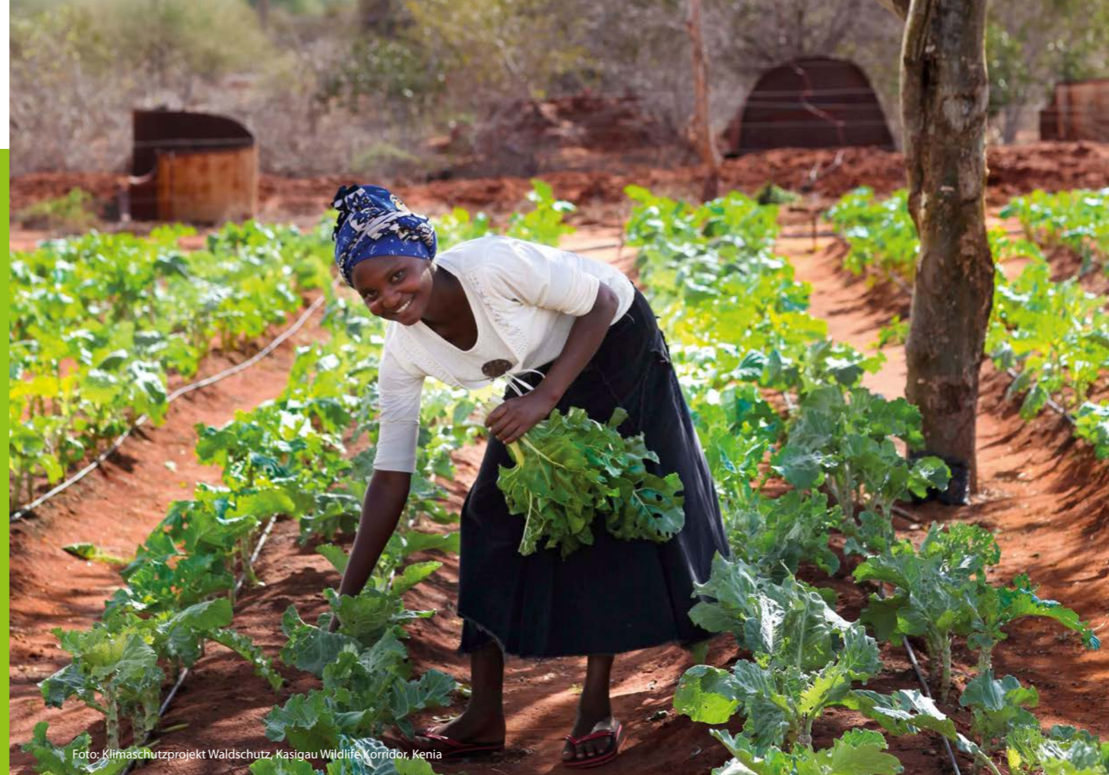
Foto: Klimaschutzprojekt Waldschutz, Kasigau Wildlife Korridor, Kenia