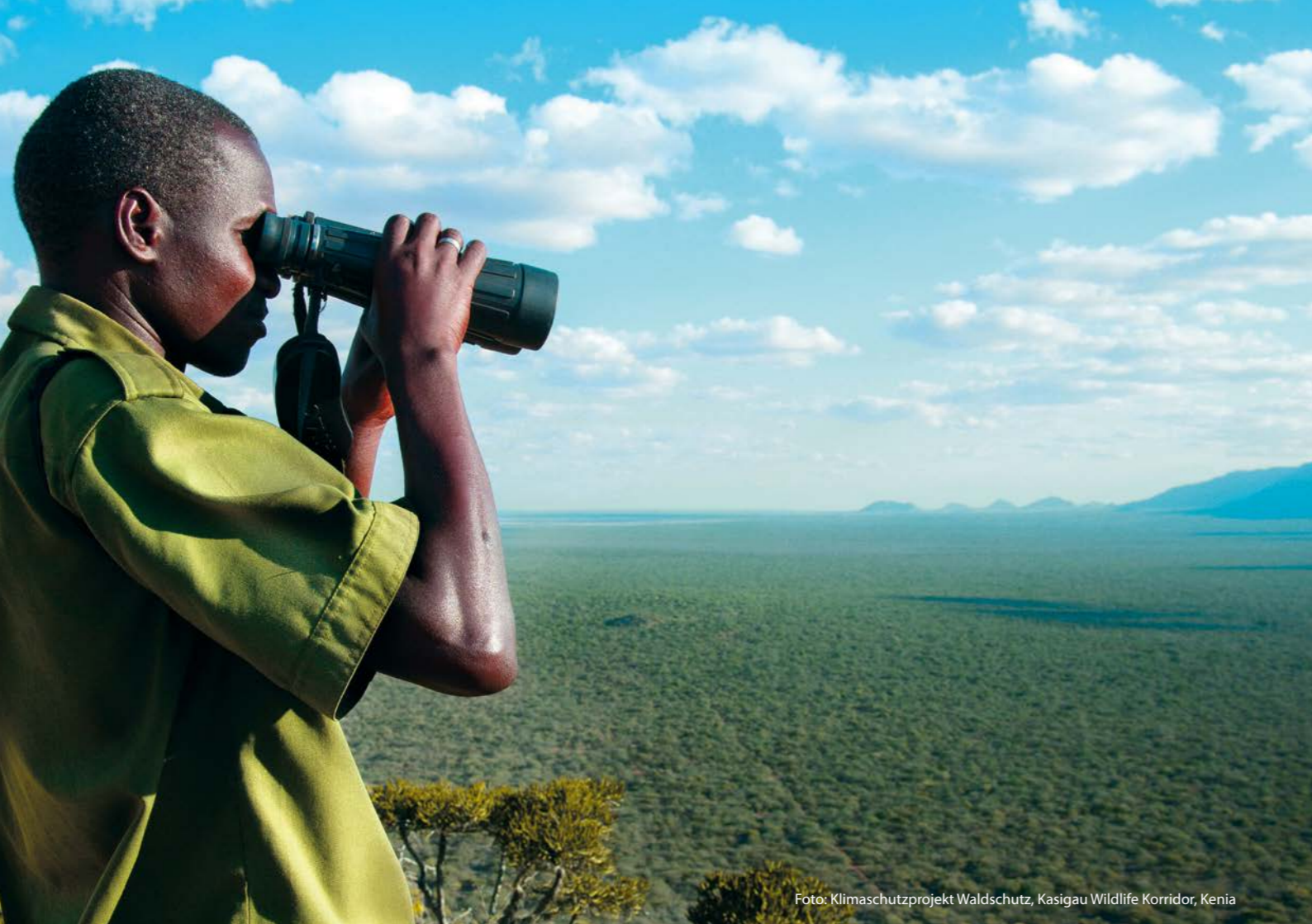
Foto: Klimaschutzprojekt Waldschutz, Kasigau Wildlife Korridor, Kenia